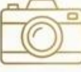
Photo d'identité formelle (Format jpeg/jpg)